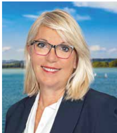
Laurence FAUTRA MAIRE DE DÉCINES-CHARPIEU TÊTE DE LISTE CIRCONSCRIPTION RHÔNE-AMONT