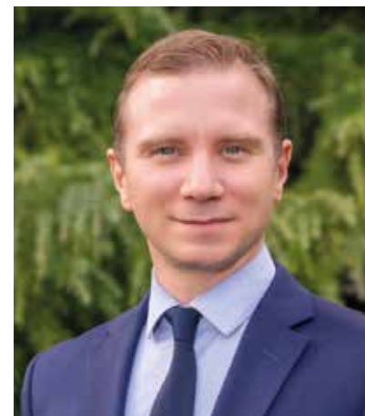
Alexandre VINCENDET MAIRE DE RILLIEUX-LA-PAPE TÊTE DE LISTE CIRCONSCRIPTION PLATEAU NORD-CALUIRE