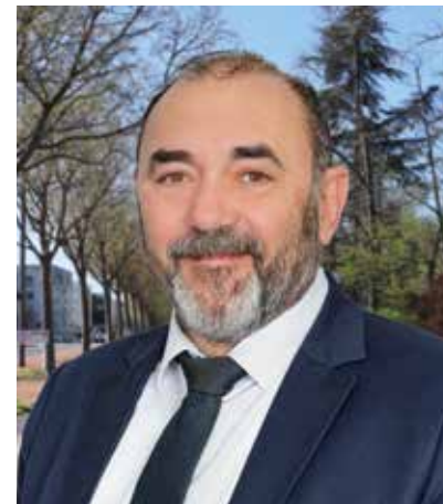
Gilles GASCON MAIRE DE SAINT-PRIEST CONSEILLER MÉTROPOLITAIN TÊTE DE LISTE CIRCONSCRIPTION PORTE DES ALPES