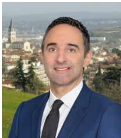
Jérôme MOROGE MAIRE DE OULLINS-PIERRE-BÉNITE TÊTE DE LISTE CIRCONSCRIPTION LÔNES ET COTEAUX