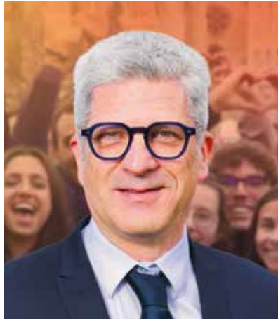
Christophe GEOURJON CONSEILLER RÉGIONAL TÊTE DE LISTE CIRCONSCRIPTION LYON SUD